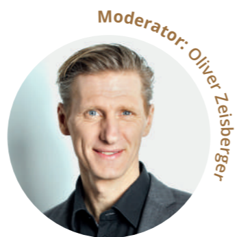
Moderator: Oliver Zeisberger